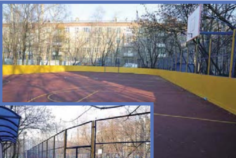
Улица Химушина, дом 9

Всё в стадии становления. И для муниципалитета пока нет критериев,