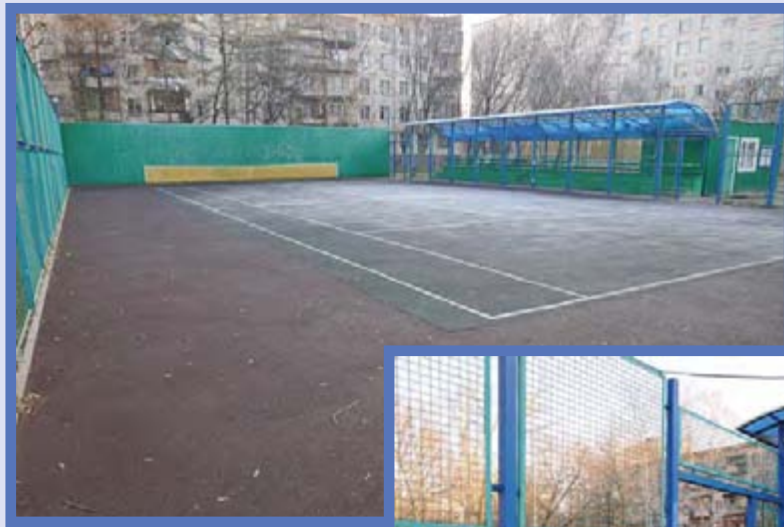
16-я Парковая улица, дом 19, корпус 3