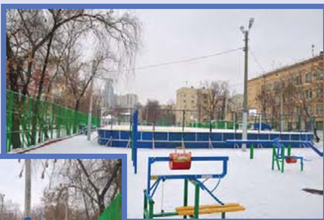
улица Гастелло, дом 7

работающим на площадках, также было рекомендовано дать свои предложения. Например, дети, занимающиеся футболом, могут вместе со своим тренером бесплатно посещать бассейн, тренажерный зал, что увеличивает статус и возможности тренера, гибкость тренировочного процесса, привлекает ребёнка и создаёт условия для работы по месту жительства. Мы должны использовать имеющийся ресурс по ФОКом и продвигать через свои легитимные формы. Если у нас на год достанется что-то муни-