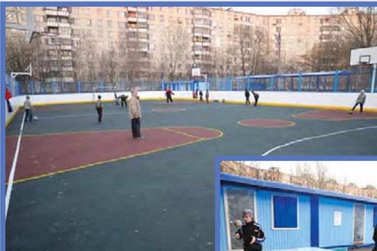
Улица Молостовых, дом 8

на балансе у Центра физкультуры и спорта, нами было предложено на первом этапе заключить соглашение с муниципалитетами (проект мы им направили) о совместном использовании и содержании павильонов, чтобы в соответствии с нормой гражданского права был договор. Большинство муниципалитетов соглашались подписать, в Перово, Новогиреево, Косино-Ухтомском, Преображенском сказали, что это незаконно. Хотя им письменно разъяснялось, что подключение к источникам энергоснабжения возможно только на основании договоров, а это значит, что кто-то должен заключить договор на поставку электроэнергии для спортплощадки. А кто может его заключить? Тот, кто может оплачивать коммунальные услуги, — то есть, в соот-