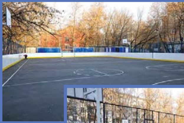
Открытое шоссе, дом 6, корпус 1

чалось реформирование спортивно-массовой работы. Муниципалитетам, как